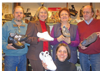
Unser Team vom Schuhhaus Riegelnegg berät Sie gerne